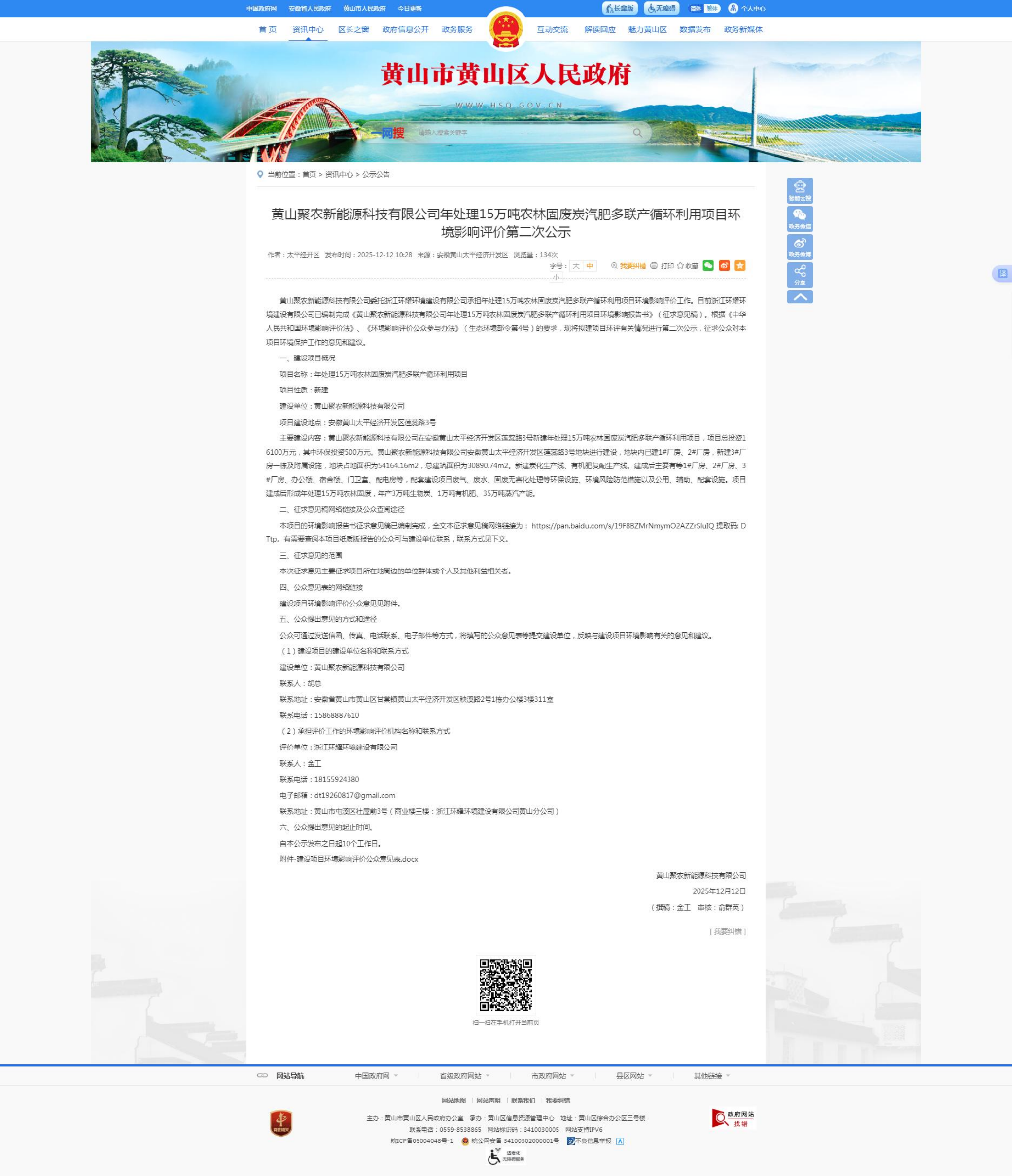
图 2：本项目 2025 年 12 月 12 日第二次网络公示截图