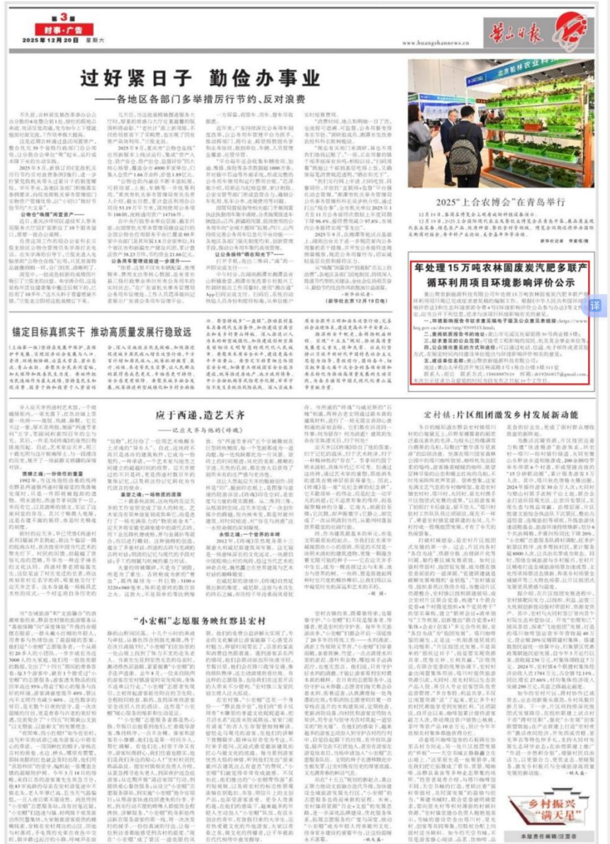
黄山日报2025年12月20日版面

黄山市聚农新能源科技有限公司年处理15万吨农林固废炭汽肥多联产循环利用项目现已完成征求意见稿的编制工作。根据《中华人民共和国环境影响评价法》和生态环境部令第4号《环境影响评价公众参与办法》等文件规定,应当公开下列信息,征求与该项目环境影响有关意见。