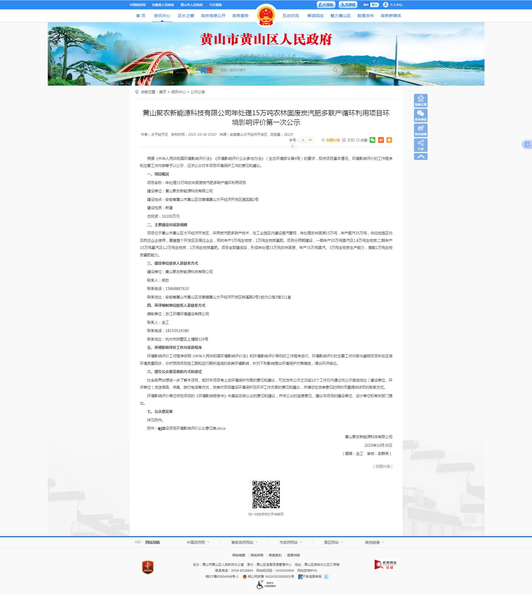
图 1：本项目 2025 年 10 月 30 日第一次网络公示截图